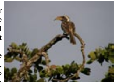
De diksnaveltok is een typische vogel van de miombo bossen

Afrika. Hoogtepunt hier is waarschijnlijk wel de green twinstop, een heel klein tropisch vinkje wat erg moeilijk te vinden is. De meeste andere specialiteiten van de regio, vind je in de miombo woodlands. Ondanks de branden in het verleden, zijn veel van de "goede" miombo-soorten aanwezig in Kasanka.