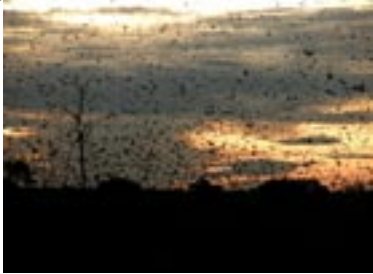
Miljoenen vleerhonden bezoeken elk jaar het park