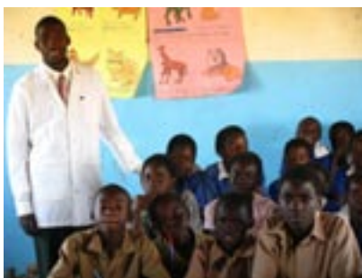
School in Nanzele wordt opgeknappt

Doelstellingen van de stichting zijn o.a. het verbeteren van de economische situatie voor mensen die in het gebied rondom de missieposten (Chikankata en Ibbwe Munyama) van het Leger des Heils wonen. Door kleinschalige projecten en ideeën van Zambianen zelf, die bijdragen aan een duurzame ontwikkeling van het gebied te realiseren hopen we hun inkomsten en levensstandaard te verbeteren. Voorbeelden van deze projecten zijn dus het opstarten van kleinschalige toeristische activiteiten onder leiding van lokaal getrainde mensen en een aantal deelnemende dorpen. Recentelijk zijn op aanvraag van een aantal boeren en het Leger des Heils enkele workshops gefinancierd door Lukamantano waarbij mannen en vrouwen getraind worden in het opzetten van een eigen bedrijfje. Hierbij wordt met behulp van een Zuid-Afrikaanse methodiek van het South African Institute for Entrepreneurship met simulatie, rollenspellen en kennisoverdracht vaardigheden bijgebracht die nuttig zijn om een handeltje of bedrijfje succesvol te maken. Met name het gebrek aan langetermijn denken en het niet herinvesteren van winsten blijken valkuilen die overwonnen moeten worden.