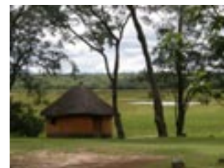
Chalet aan lake Wasa

Met 400km 2 is Kasanka een relatief klein park. De kracht van het park zit 'm in de enorme diversiteit aan biotopen en daarmee planten en dieren. Er komen verschillende rivieren samen, die vruchtbare vloedvlaktes vormen met grasland, open water, papyrus- en