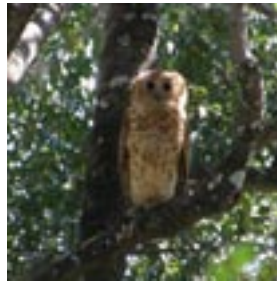
Pel's visuil: een specialiteit van het park

Het gebied is ooit als park aangewezen vanwege de grote dichtheid aan zoogdieren, en dan met name de sitatoenga. Deze moerasantiloop is typisch voor het regenwoud en grote moerasgebieden, maar is overal schaars en moeilijk te vinden. Kasanka is de enige plek waar je deze geheimzinnige beesten gegarandeerd te zien krijgt. In het centrum van het park bevindt zich een platform op 18 meter hoogte in een enorme mahonie boom. Vanaf hier kijk je uit over het papyrusmoeras waar tientallen sitatoenga leven.