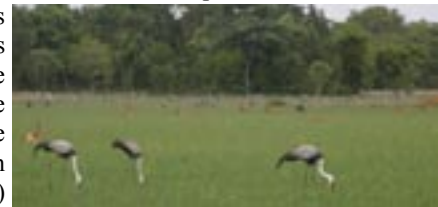
Leikraanvogels en puku's